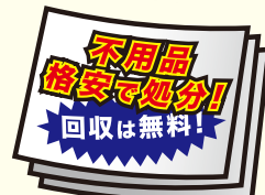
チラシやダイレクトメール