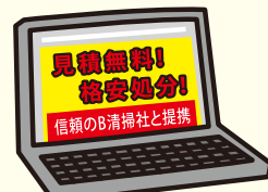
ホームページの情報

「不用品を無料で回収」。この魅力的なフレーズこそが落とし穴です。回収は無料でも「運搬や処分は別料金である」として、法外な金額を要求してくるというケースや、問い合わせの段階では無料回収と言いながら、引き取りの段階になって「思っていたより品物が大きいから」「処分費用が高騰しているから」などと理由をつけ、高額な料金を要求してくるというケースが多数報告されています。これはもはや悪徳業者の常套手段であると言えます。