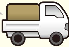
違法業者の回収車